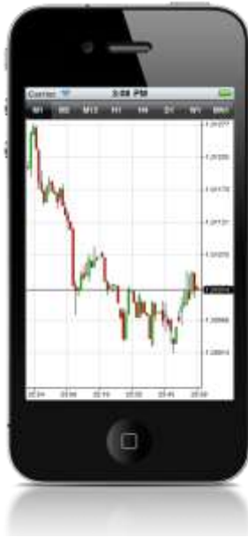
Teljes nézet – Álló (függőleges) kép

A „chart” terület kétszeri megérintésével a kereskedési grafikonokat felnagyított nézetben láthatja. Mindkét grafikon-nézetben lehetősége van arra, hogy az ábrákat felnagyítsa vagy lekcicsinyítse (zúmolni két ujjá összezárásával illetve szétnyitásával tud); bármelyik grafikonnál a képernyő tetején lévő fülek segítségével átválthat egyik időszakról egy másikra, és visszalapozhat a grafikonra. Ezen felül, ha az adott grafikont teljes képernyőn futtatja, és az iPhoneet vízszintesen tartja, akkor a grafikon szélesebb nézetre váltva jelenik meg.