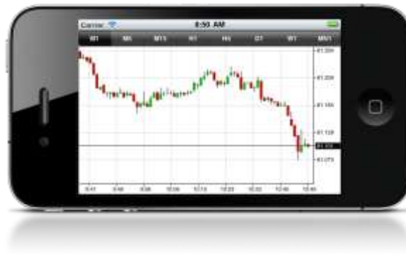
Teljes nézet – Fekvő (vízszintes) kép